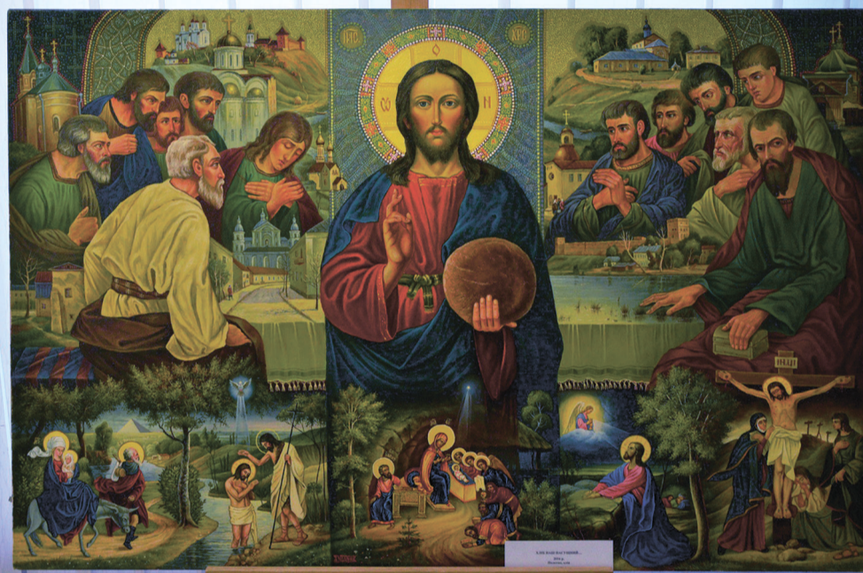
«ХЛІБ НАШ НАСУЩНИЙ», 2016 р. Полотно, олія. Музей волинської ікони

Образно автор трактує стіл, за яким відбувалася Тайна вечеря: майже всю горизон-